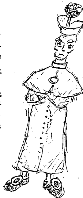
Figura alta, ieratica. Di quelle che mettono soggezione. Vestiva con abito talare lungo e ostentante una fila di innumerevoli bottoni dal collare fino a terra. Sulle spalle, anche in estate, una corta cappa chiusa, sul davanti, da una grossa fibbia d'argento. Le enormi scarpe, pure loro, con vistose fibbie settecentesche. L'immane copricapo a tricorno classico. Durante le prediche in chiesa, teneva costantemente gli occhi rivolti in alto. Forse aveva un modo preferenziale di comunicare con Lassù.

Per questa occasione ci limitiamo a riportare la descrizione con relativo schizzo di come l'amico Sergio ricorda "l'Sciur Prevòst" di quei tempi: