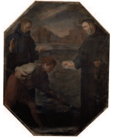
PRIMA DEL RESTAURO: Scuola lombarda della metà del XVII sec., Miracolo della roncola , Olio su tela di m 2, 35 x 2, Pavia, San Salvatore

Il Navigliaccio infine sottoattraversa la Via Riviera, entrando nel fabbricato dell'ex arsenale militare di Pavia attraversandone l'intera area per poi sfociare nel Fiume Ticino al ponte della ferrovia. Certo è che le corrispondenze fra le diverse zone cittadine sono oggi difficili da visualizzare a causa dell'interruzione degli assi viari e dell'affastellamento degli interventi edilizi, ma pur nell'approssimazione di una prospettiva intuitiva, gli elementi del ponte, della chiesa e del bastione difensivo emersi nel fondale del dipinto a seguito del recente restauro non possono non porre interrogativi sul possibile recupero di una nuova immagine di S. Salvatore.