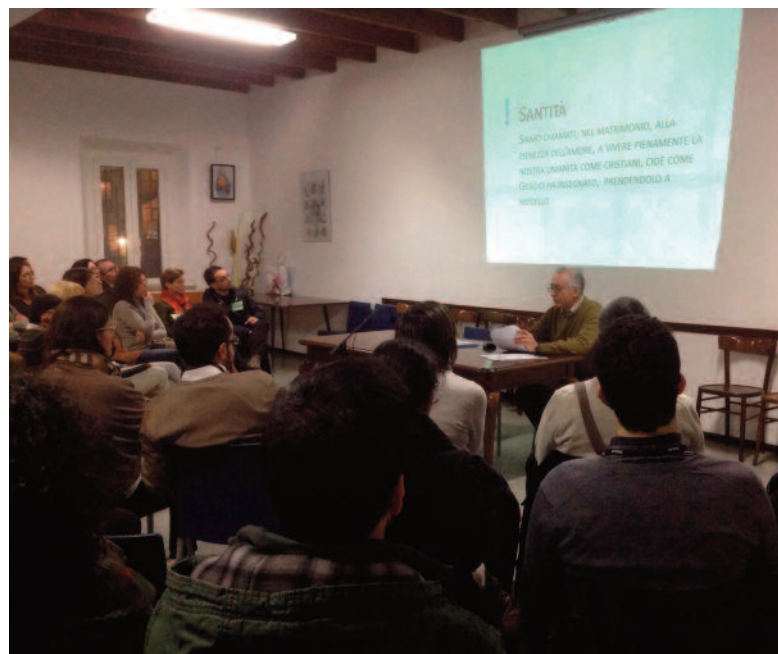
28 Famiglie hanno partecipato al corso questo anno

Che esso resti sempre espressione genuina del tuo, senza che il gusto intenso di sentirci vicini attenui il sapore della tua presenza fra noi, e senza che il reciproco godimento