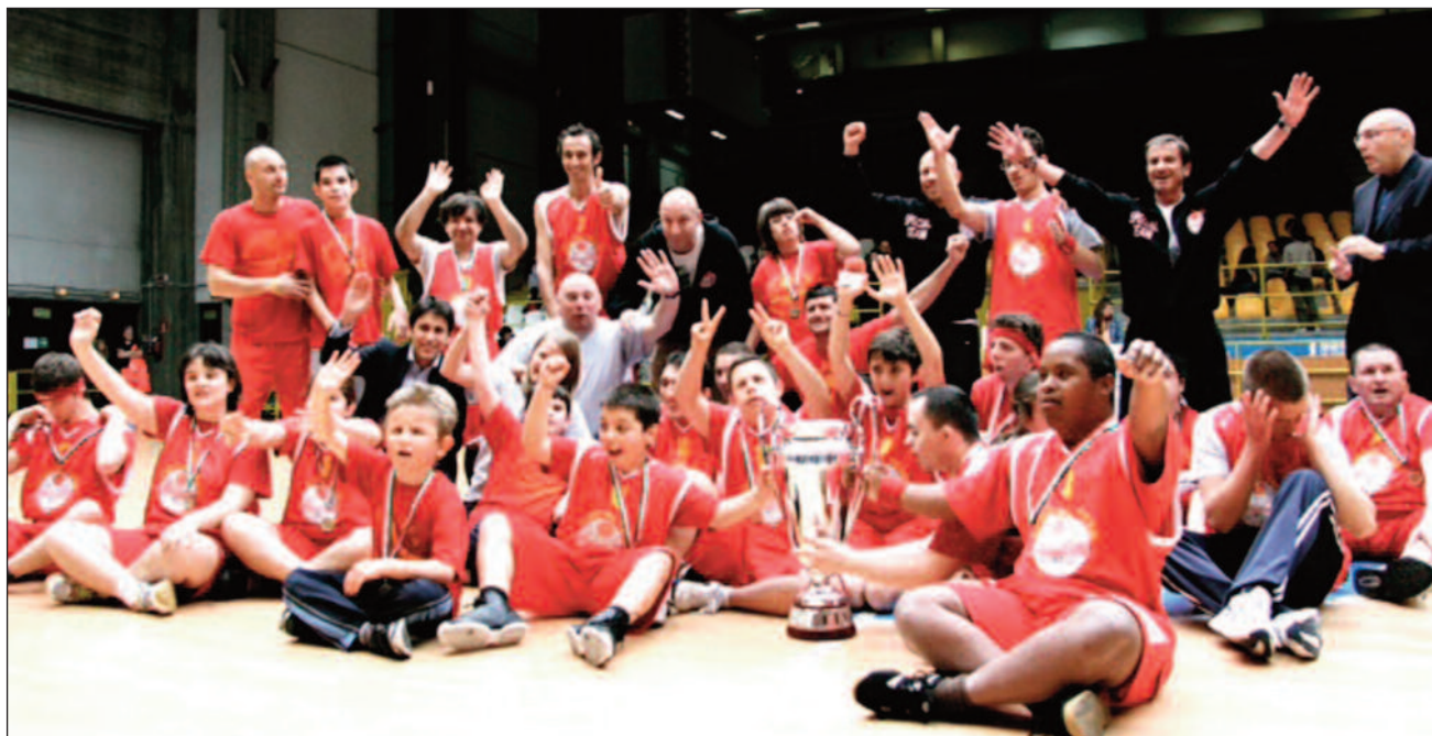
Una foto della manifestazione al PalaRavizza in cui lo Special Team ha trionfato

Per tutte quelle persone che collaborano a questa bellissima iniziativa e li