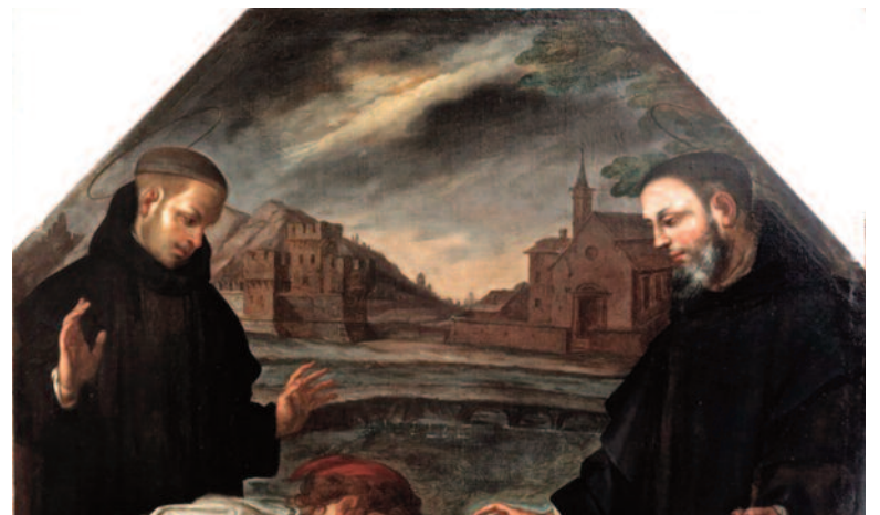
DOPO IL RESTAURO: dettaglio del paesaggio con S. Salvatore sulla destra, il bastione di Borgoratto a sinistra e il ponte di pietra sul lago.