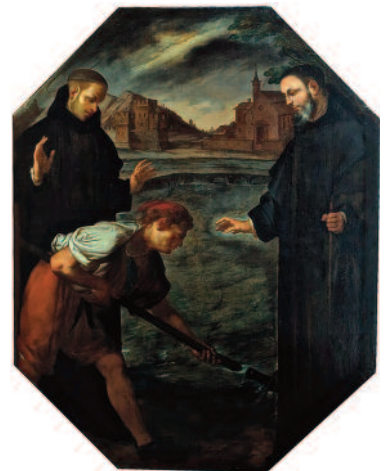
DOPO IL RESTAURO