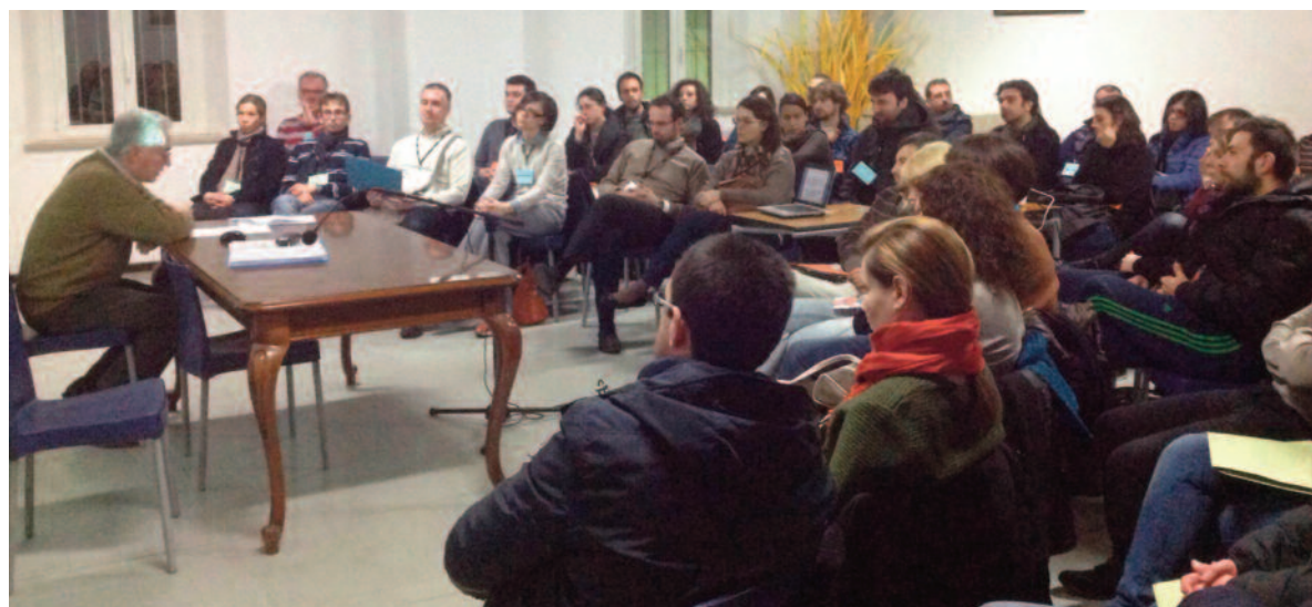
L'equipe composta da famiglie della parrocchia ha saputo arricchire il corso con la propria esperienza