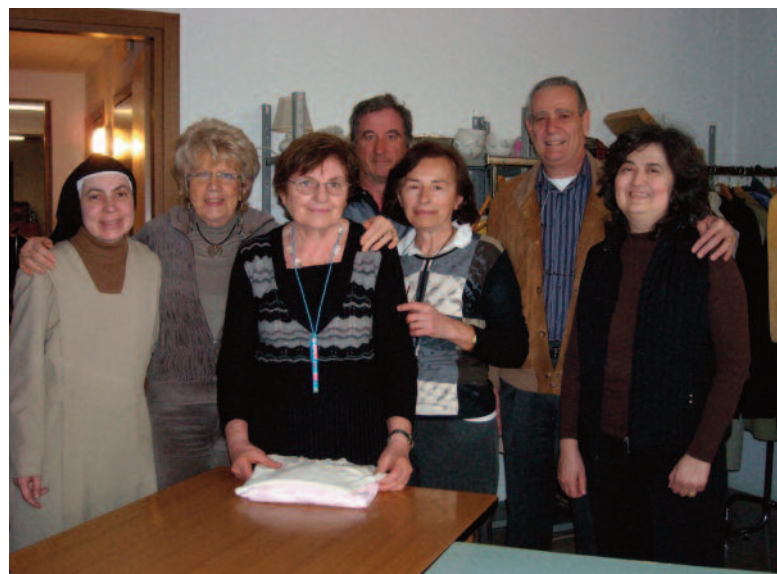
Il gruppo vincenziano con i nuovi volontari all'armadio del Fratello