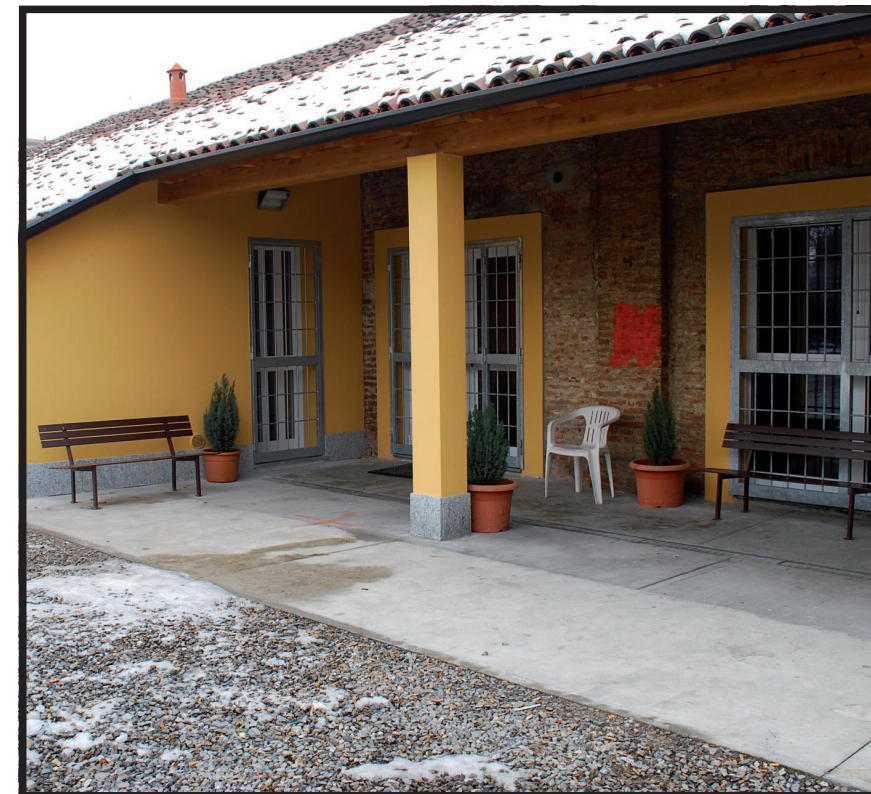
L'esterno del centro di ascolto

sando al “cosa fare” prima che all’ “esserci per..”, si rischia di fatto di mettere al centro il proprio “io”, la propria competenza e la propria presunta efficienza. Laddove, invece, ci si concentra sull’ascolto, si mette al centro il povero. Si completa la mensa materiale con una mensa spirituale, intesa come luogo primario di relazione e di testimonianza. La realizzazione di questo progetto ora è possibile grazie ai nuovi ed idonei locali ricavati dalla recente ristrutturazione. Ci sono i muri, ci