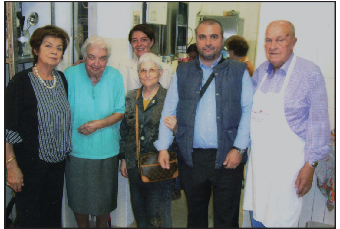
Volontari di ieri