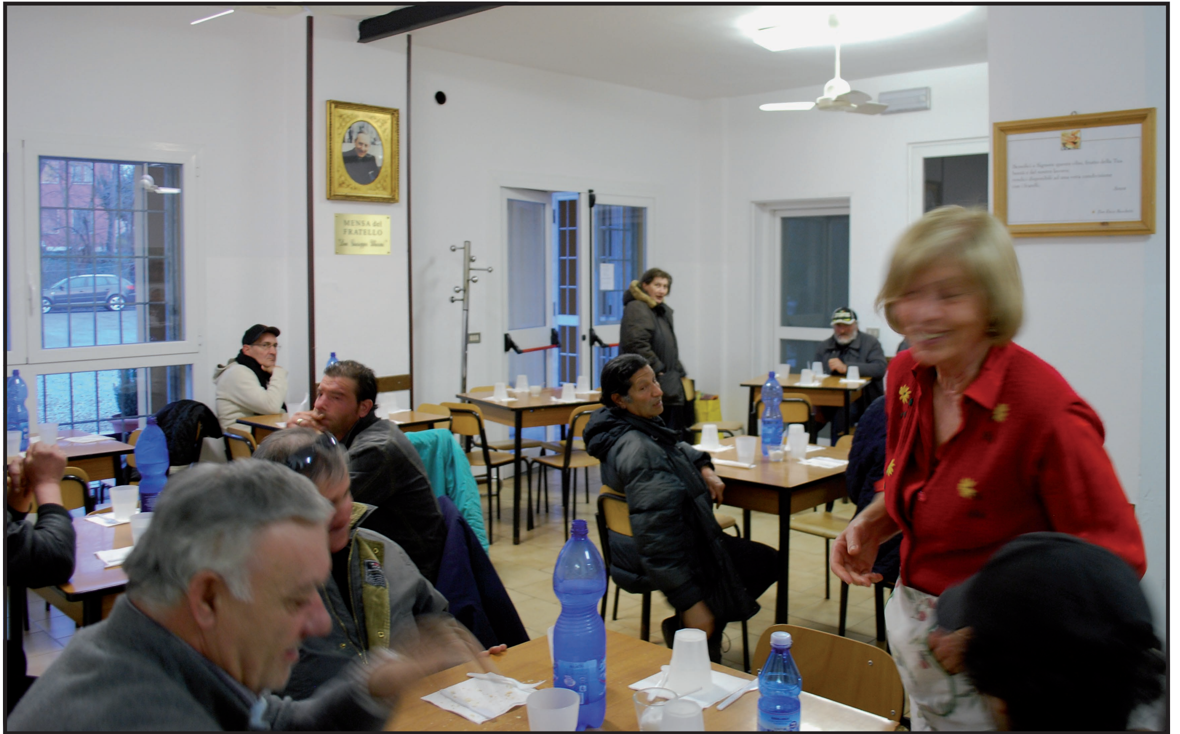
La mensa ed i suoi ospiti