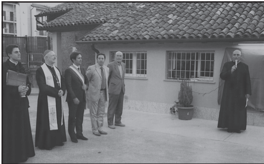
Un momento dell'inaugurazione dei locali ampliati nel 2011