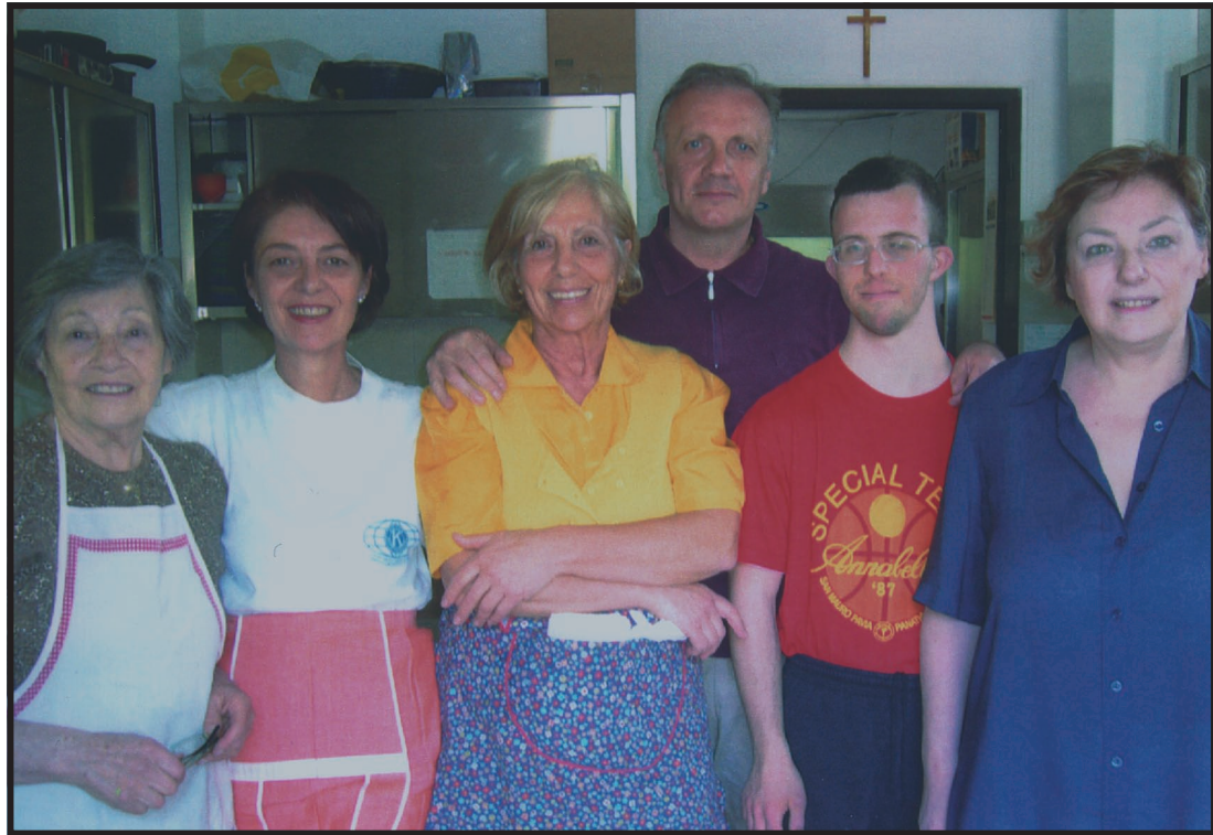
Volontari di oggi