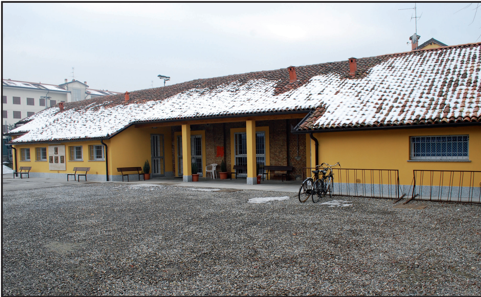
L'attuale esterno della mensa e del centro di ascolto

A 25 anni dall'apertura della “mensa del fratello”, luogo di accoglienza e di servizio, la nostra comunità ravvisa il bisogno di offrire ai poveri un dono concreto, strutturato, in grado di mettere meglio al centro la loro persona. “Tutto quello che avete fatto a uno solo di questi miei fratelli più piccoli, l'avete fatto a me” (Matteo, 25): l'invito è chiaro e categorico. Se Cristo vive nel povero, lo conosco e lo accolgo accogliendo il povero. Il primo ed importante momento dell'accoglienza e della relazione con l'altro è l'ascolto. Per noi il modello resta sempre la figura di Gesù, che ha fatto dell'ascolto rispettoso ed accogliente l'opportunità di offrire liberazione e salvezza. D. Bonhoeffer diceva che “il primo servizio che si deve al prossimo è proprio quello di ascoltarlo”. Il Card. Martini ribadisce che “le persone hanno più bisogno di ascolto che di parole, anche se, a volte, si pensa che ascoltare sia tempo perso” (Lettera alla Diocesi-Natale 1989), Accade facilmente, magari senza rendersene conto, che si aiutino le persone senza averle prima di tutto accolte veramente. Pen-