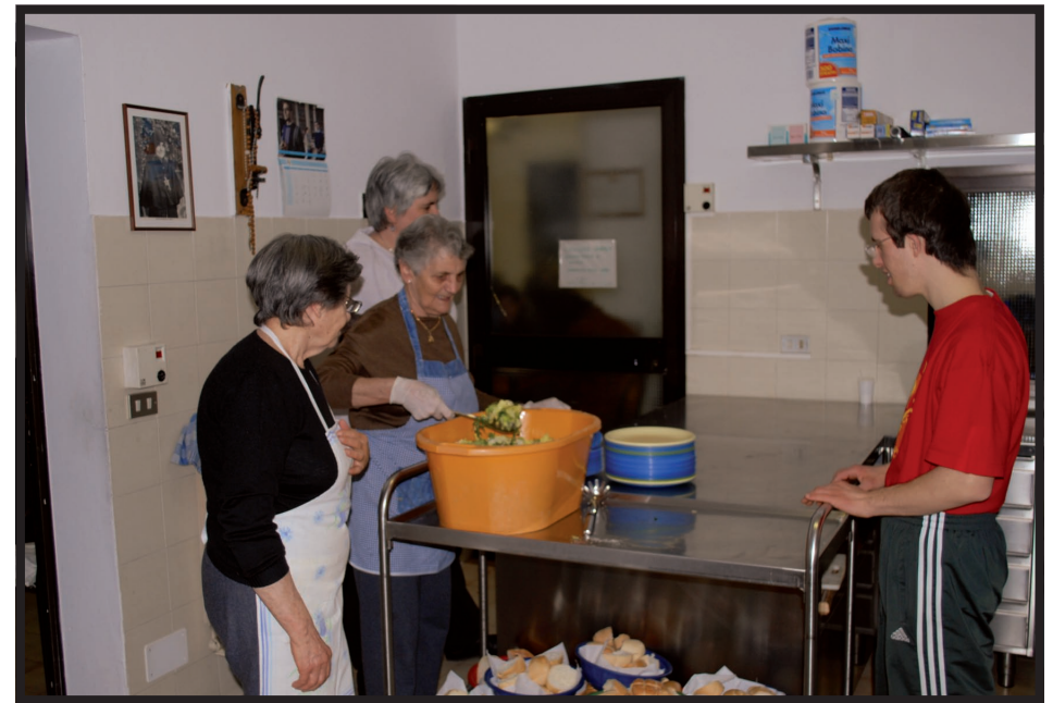
La preparazione dei cibi