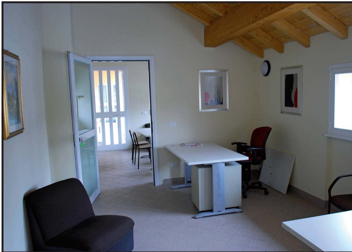
L'interno del centro di ascolto

sando al “cosa fare” prima che all’ “esserci per..”, si rischia di fatto di mettere al centro il proprio “io”, la propria competenza e la propria presunta efficienza. Laddove, invece, ci si concentra sull’ascolto, si mette al centro il povero. Si completa la mensa materiale con una mensa spirituale, intesa come luogo primario di relazione e di testimonianza. La realizzazione di questo progetto ora è possibile grazie ai nuovi ed idonei locali ricavati dalla recente ristrutturazione. Ci sono i muri, ci